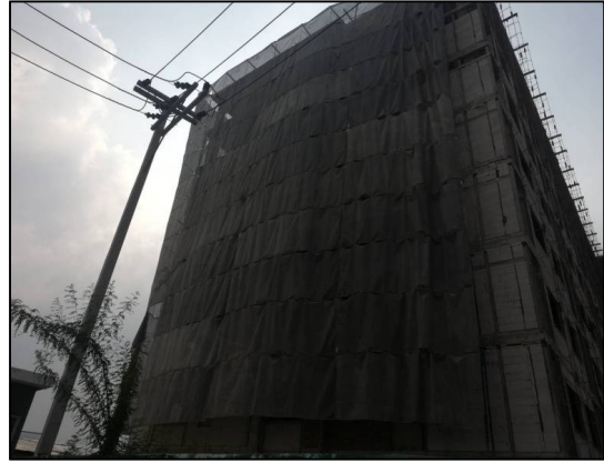
ภาพที่ 1.6 สถานภาพการก่อสร้างโครงการในปัจจุบัน